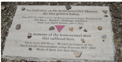
Denkmal für die ermordeten Homosexuellen in der Gedenkstätte Buchenwald.

Anschließend Auswertung des Tages und des Gedenkstättenbesuchs